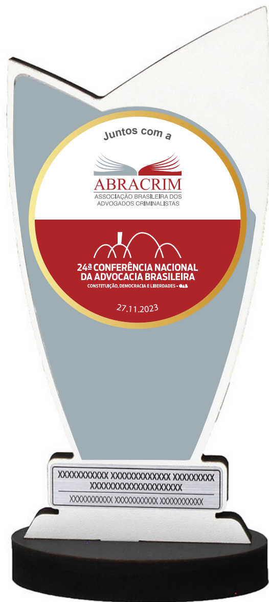
Troféu de acrílico